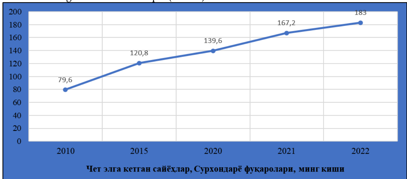
2-rasm. 2010-2022-yillarda Surxondaryo viloyati turizm korxonalarining aholiga ko'rsatgan xizmatlari

Hozirgi kunda bu ayniqsa, umra safariga jo'natishni e'tiborga oladigan bo'lsak, ko'plab mamlakatimizdan chiqib ketayotganlar soni mamlakatimizga tashrif buyuruvchilar sonidan sezilarli darajada oshib borayotganini kuzatish mumkin. Bu esa mamlakatimiz byudjetini shakllantirishga salbiy ta'sir ko'rsatuvchi omillardan biridir. 2010-2022-yillar davomida Surxondaryo viloyatida turizm industriyasining rivojlanish dinamikasining o'sishi kuzatilmoqda (2-rasm).