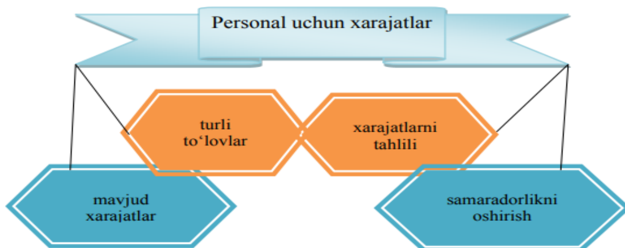
2-rasm. Personal uchun xarajatlar

Kadrlar siyosatini aniq rejalashtirib, ishlab chiqib va amalga oshirmasdan turib tashkilotning barcha muhim bo'limlarini o'z vaqtida kadrlar bilan ta'minlash mumkin emas. Korxonaning xodimga bo'lgan ehtiyojini rejalashtirish mehnat bozoridagi ishchi kuchiga talab va taklif muvozanatiga bog'liq.