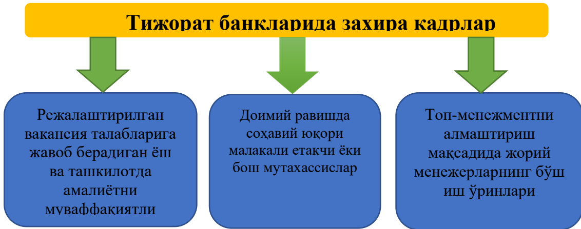
1-расм. Тижорат банкларида захира кадрларни шакллантириш манбалари 2

Рақамли трансформациялар шароитида тижорат банкларининг кадрлар сиёсатидаги асосий мақсадлари нафақат режалаштирилган вакансия талабларига жавоб берадиган ёш ва ташкилотда амалиётни муваффақиятли тамомлаган мутахассисларни режалаштириш эмас балки, доимий равишда соҳавий юқори малакали менежер ва мутахассислар захирасини шакллантириш кераклигини 1-расмда кўришимиз мумкин.