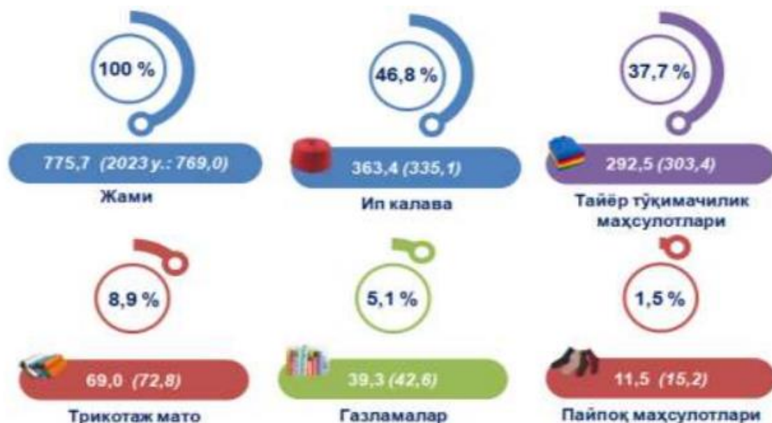
1-расм. Тўқимачилик маҳсулотлари экспорти динамикаси (2024 йил январь-март, млн. АҚШ доллари) [13]

Сўнгги йилларда енгил саноатда юқори қўшилган қийматдаги маҳсулотлар ишлаб чиқариш ривожланиб бормоқда. Енгил саноат иқтисодий жиҳатдан Ўзбекистон учун муҳим соҳа бўлгани ҳолда, аҳоли бандлигининг юқори даражасини, шунингдек, саноат салоҳиятига ҳамда давлатимизнинг халқаро нуфузига ҳисса қўшилишини таъминлайди. Тўқимачилик маҳсулотларининг экспорти ҳажмлари ошишини бевосита пахта хом-ашёсини ўрнига тайёр маҳсулот ишлаб чиқариш ва қўшимча қиймат яратиш мақсадида амалга оширилган ислохотлар натижаси сифатида қараш мумкин. Шунингдек, сўнгги йилларда саноат ва қишлоқ хўжалигидаги туб ўзгаришлар туфайли экспорт таркиби сезиларли даражада ўзгарди. Хусусан, экспортдаги пахта толаси улуши кескин камайди ҳамда 2010 йилда улуш 12,1 % ни ташкил этган бўлса, 2023 йил якунларига қўра эса бу кўрсаткич 0,2 фоизни ташкил этди. Бу шунингдек, тўқимачилик саноатида қўшимча қийматга йўналтирилган сиёсат самарали ва хом ашё сифатида камроқ пахта толалари экспорт қилинмоқда.