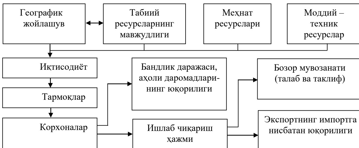
1-расм. Саноат тармоғининг иқтисодий салоҳияти тузилиши 2

Иқтисодий салоҳият тушунчаси ишлаб чиқариш кучлари фаолиятининг турли хил тарихий босқичлари таркибий қисмларини ўз ичига олиб, улар орасида инсон ресурслари салоҳияти ва ижтимоий ишлаб чиқариш тармоқларининг ишлаб чиқариш салоҳиятлари яқин-яқиндан ҳисобга олина бошланган.