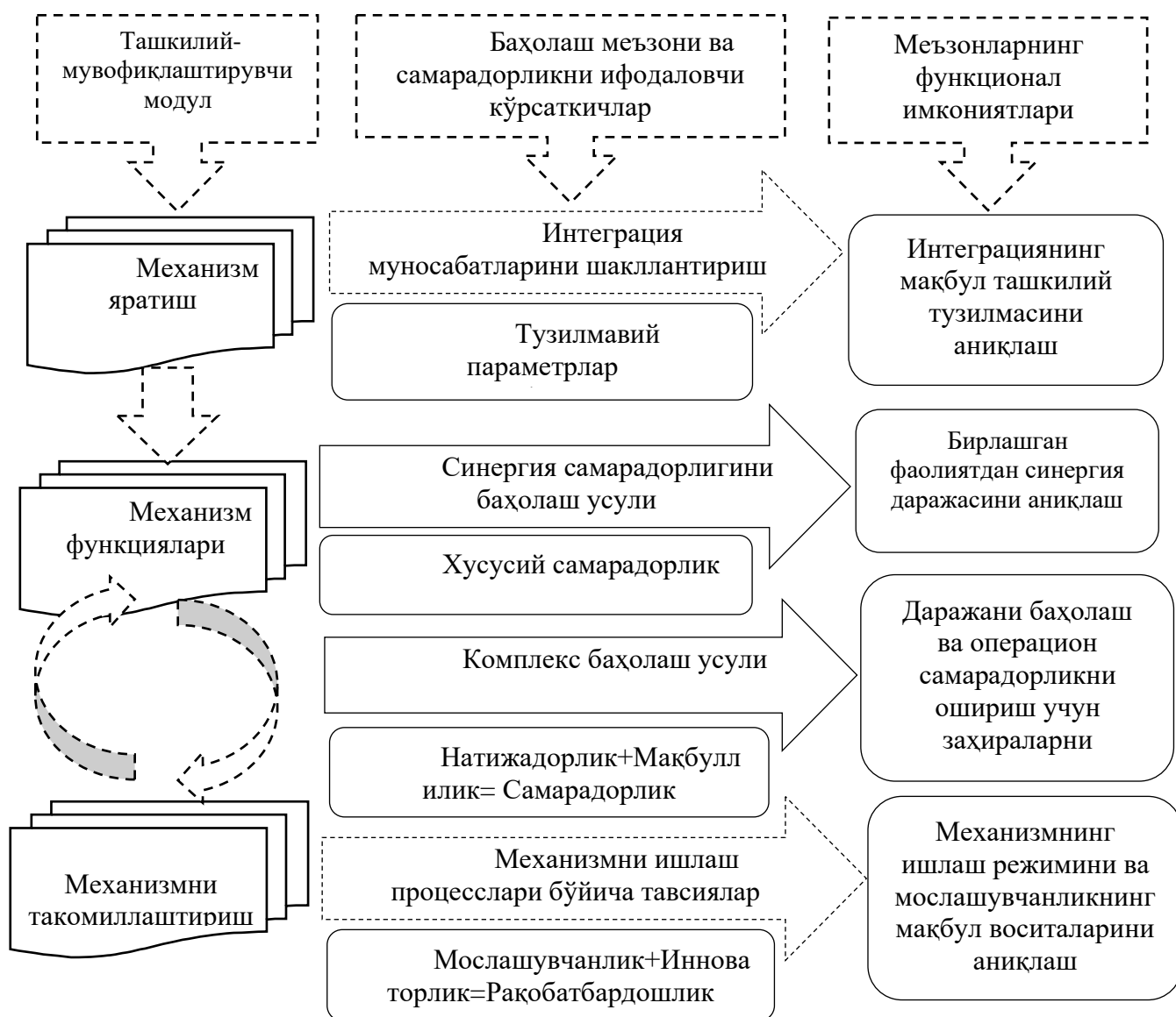
2-расм. Озиқ-овқат саноати корхоналарини интеграциялаш жараёнини услубий жиҳатлари 2

Интеграция жараёнида содир бўладиган корхоналарнинг қўшилиши, ажралиб чиқиши, бўлиниши каби босқичлар ташкилий-иқтисодий механизм ўзгаришига таъсир кўрсатади. Шунинг учун ташкилий-иқтисодий механизмни ишлаб чиқишда аввало корхонанинг аниқ тузилмасини белгилаб олиш, молиявий, ташкилий, иқтисодий жиҳатларини баҳолаш зарур.