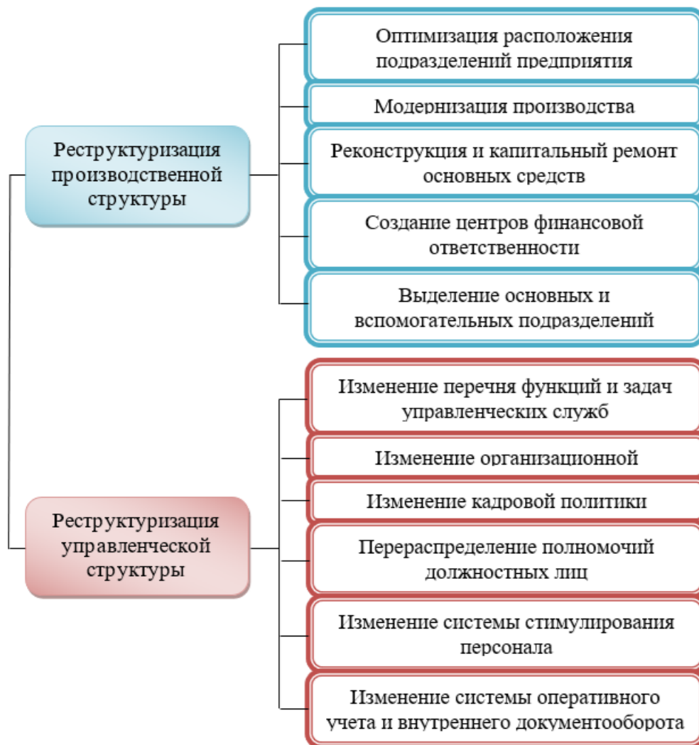
Рисунок 2 - Структурный аспект реструктуризации текстильных предприятий

Организационный аспект реструктуризации текстильных предприятий целесообразно рассматривать в разрезе трех процессов: ингрессионные, ингрессионно-дезинтегрессионные, дезинтегрессионные (рисунок 3). При этом к ингрессионным процессам относятся следующие мероприятия: создание (хозяйственных обществ, товариществ, акционерных обществ), соединение (независимых предприятий, основного и дочернего предприятий), образование (независимых предприятий, создание совместных предприятий, зависимых предприятий), деление-соединение (покупка-продажа части предприятия, франчайзинг, создание совместных предприятий). Ингрессионно-дезинтегрессионные процессы включают преобразование, деление. В состав дезинтегрессионных процессов входит разделение и ликвидация.