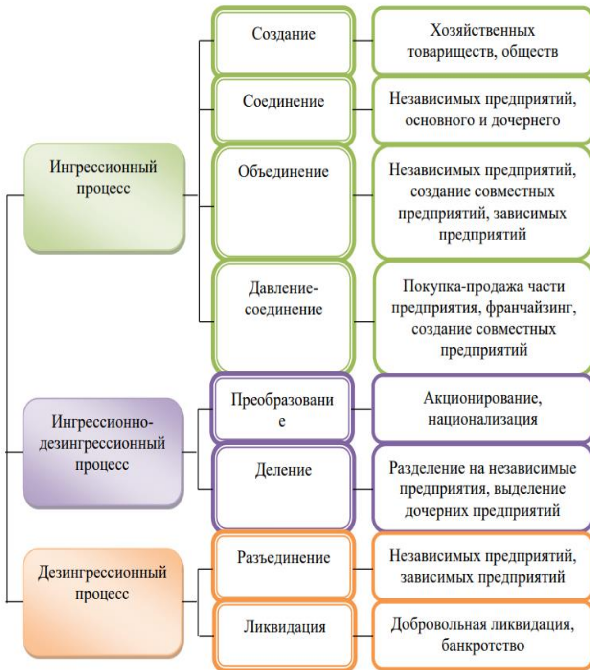
Рисунок 3 - Организационный аспект реструктуризации текстильных предприятий

Финансовый аспект реструктуризации текстильных предприятий состоит из следующих мероприятий: изменения состава участников, изменение состава и структуры активов, реструктуризация дебиторской и кредиторской задолженности (рисунок 4).