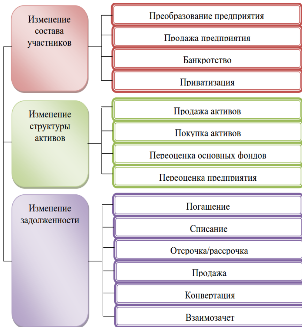
Рисунок 4 - Финансовый аспект реструктуризации текстильных предприятий.

В рамках проведенного исследования особое внимание уделено процессам интеграции предприятий как механизму создания корпоративных образований.