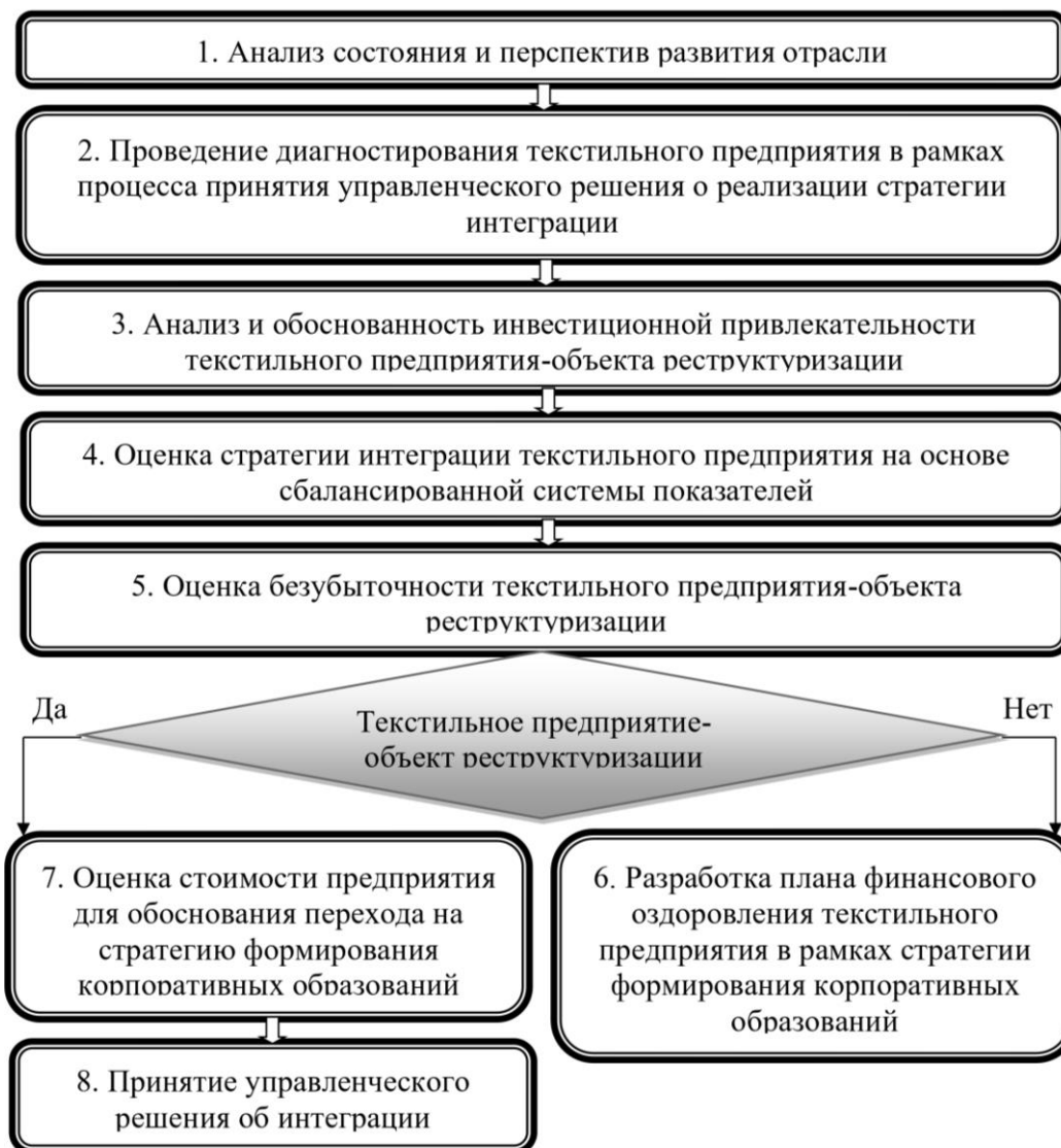
Рисунок 5 - Блок-схема организационно - экономического механизма формирования интегрированных корпоративных образований в текстильной промышленности

При этом под механизмом формирования интегрированных корпоративных образований в текстильной промышленности следует понимать систему организации последовательного взаимодействия элементов, реализация которого позволяет инвестору принять обоснованное управленческое решение об интеграции.