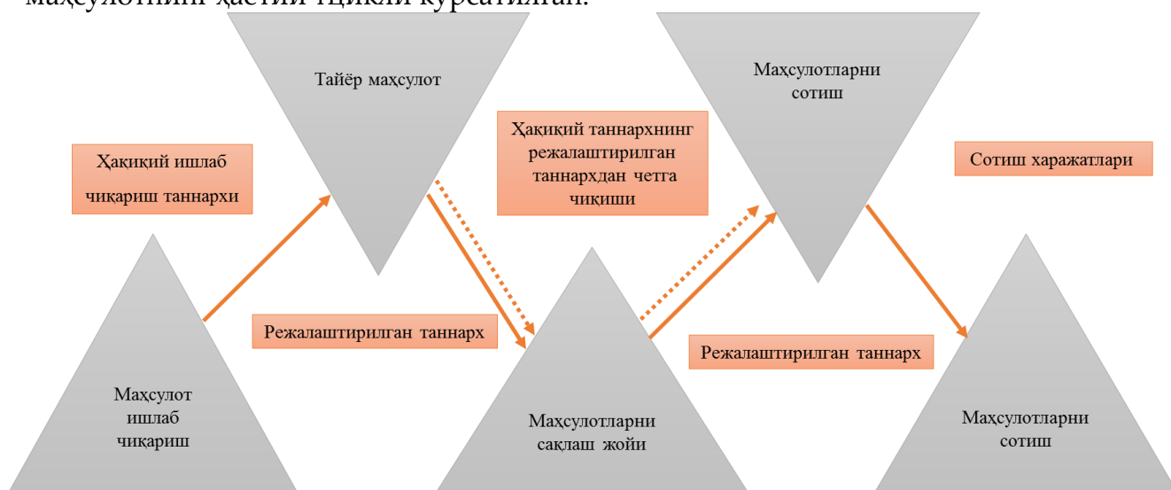
2-расм. Енгил саноат корхонасида тайёр маҳсулотларнинг

Тайёр маҳсулотни чиқариш саноат сектори субъектларининг асосий фаолиятидир. Тайёр маҳсулотлар маҳсулотлар, ярим тайёр маҳсулотлар, ишлар ва хизматлар кўринишида тақдим этилиши мумкин. 2-расмда корхонада тайёр маҳсулотнинг ҳаётий тцикли кўрсатилган.