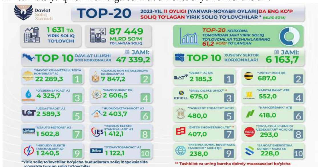
1 – rasm. 2023 – yilning yanvar – noyabr oylarida eng ko'p soliq to'lagan yirik soliq to'lovchilar ro'yxati

➤ realizatsiya qilish joyi O'zbekiston Respublikasi bo'lgan elektron shakldagi xizmatlarni realizatsiya qilishni amalga oshiruvchi chet el yuridik shaxslari. 1