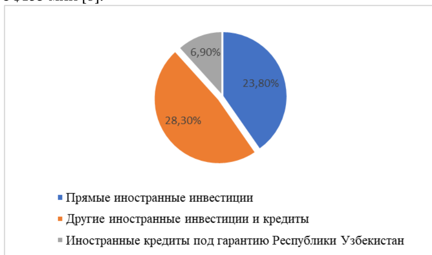
Диаграмма 2. Страны-инвесторы с наибольшей долей в объеме иностранных инвестиций и кредитов 3

Российская компания "ТАТНЕФТЬ" выступает в качестве инвестора в нефтехимическую промышленность Узбекистана с новым проектом. В 2022 году она приобрела Ангренский завод по производству шин и модернизировала его. Кроме $80 млн инвестиций компания взяла на себя обязательство погасить задолженность завода в размере $153 млн [8].