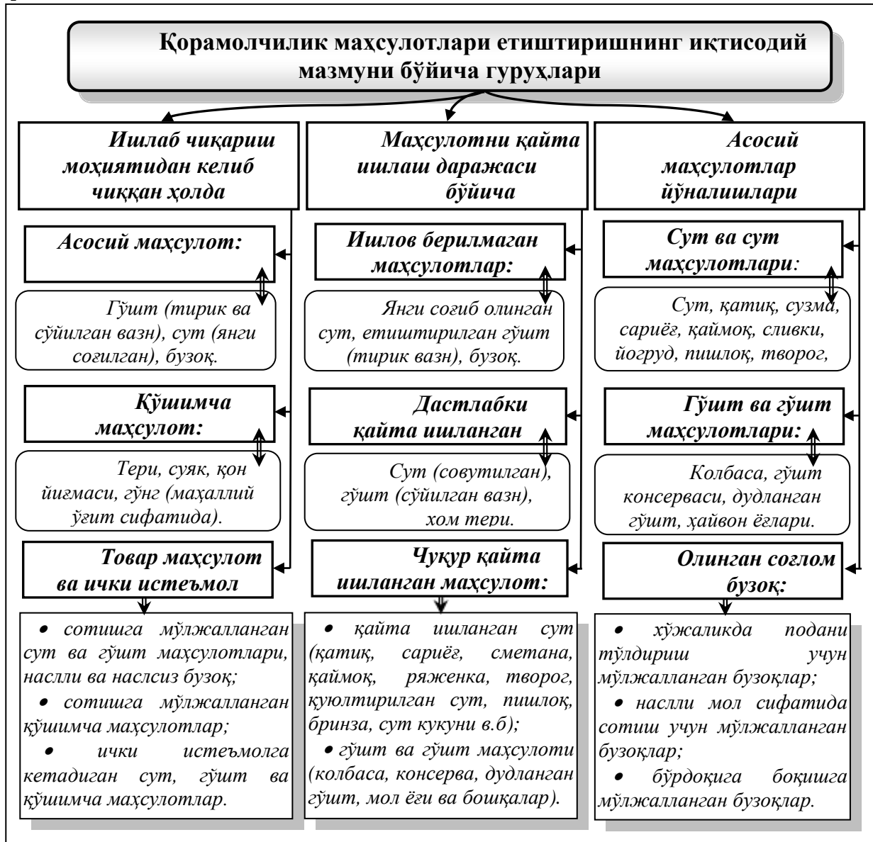
1-расм. Қорамолчилик маҳсулотларининг ишлаб чиқариш мазмуни ва қайта ишлашни ҳисобга олган ҳолдаги гуруҳлари таркиби 1

Республикада шакланган қорамолчилик тармоғи ва маҳсулот етиштириш турлари ҳамда ассортиментига эътибор қаратиладиган бўлса, маълум йўналишлардаги ва ассортиментдаги маҳсулотлар етиштириш тизими юзага келганига гувоҳ бўлиш мумкин. Уларни қуйидаги гуруҳларга бирлаштириш мумкин (1-расм).