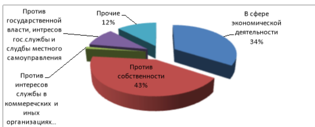
Рис.3 Формирование структуры экономической безопасности на предприятиях [7]

Неравенство: Отсутствие экономической безопасности может усугублять неравенство в обществе. Богатство и возможности распределяются неравномерно, что создает разрыв между бедными и богатыми слоями населения. Неравенство может привести к социальному недовольству, нарушению социальной справедливости и утрате доверия в обществе. Миграционные кризисы: Отсутствие экономической безопасности может стать причиной массовых миграционных потоков. Люди могут вынуждены искать лучшие экономические возможности и обеспечение в других странах или регионах, что может привести к миграционным кризисам и волнам беженцев. Это может создавать сложности для стран-приемников, а также увеличивать риск социальных и политических конфликтов. Угроза миру: Отсутствие экономической безопасности в одной стране или регионе может иметь отрицательные последствия для мирового порядка и международной безопасности. Экономические кризисы, социальные конфликты и нестабильность могут распространяться на другие страны через экономические, политические и социальные связи. Это может привести к нарастанию напряженности между государствами, конфликтам и даже угрозе миру.