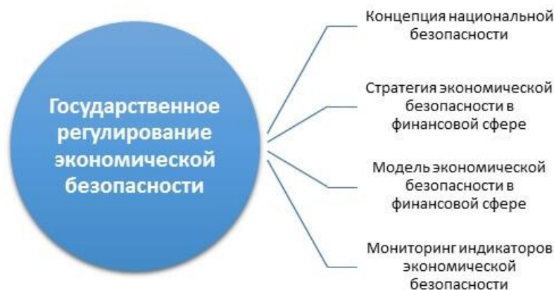
Рис.1 Виды государственного регулирования экономической безопасности [3]

Национальная система регулирования экономики включает в себя объекты, субъекты и предметы регулирования, а также институты, функции, методы и формы ГРЭ.