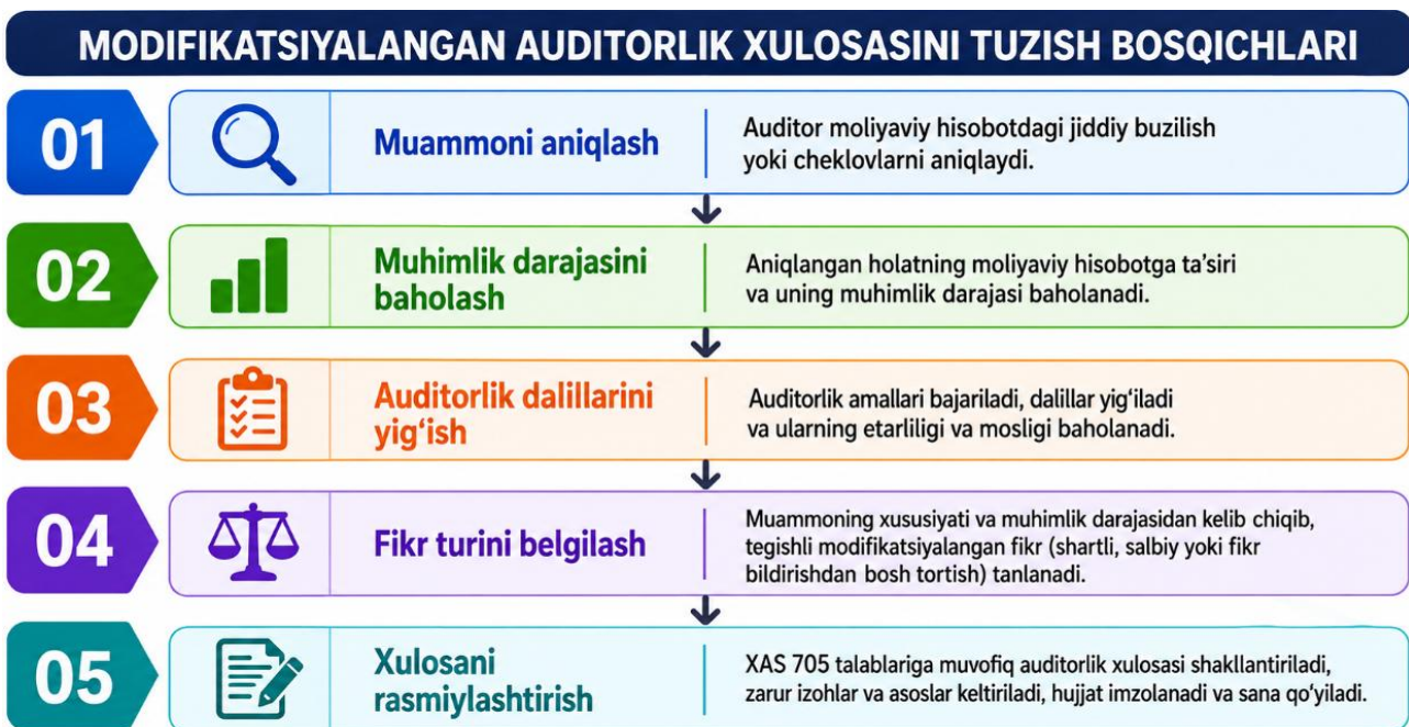
2-rasm. Modifikatsiyalangan auditorlik xulosasini tuzish bosqichlari 2

Fikr bildirishdan bosh tortish auditor yetarli va mos auditorlik dalillarini olish imkoniyatiga ega bo'lmagan holatlarda qo'llaniladi. Bunda dalillarni olishga to'sqinlik qiluvchi omillar yoki cheklovlar juda muhim va keng qamrovli bo'lib, auditor moliyaviy hisobot haqqoniyligi bo'yicha ishonchli xulosa chiqara olmaydi. Shu sababli auditor moliyaviy hisobot yuzasidan ijobiy yoki salbiy fikr bildirishdan voz kechadi. Bu holat moliyaviy hisobot albatta noto'g'ri degani emas, balki auditorda yetarli asos mavjud emasligini anglatadi.