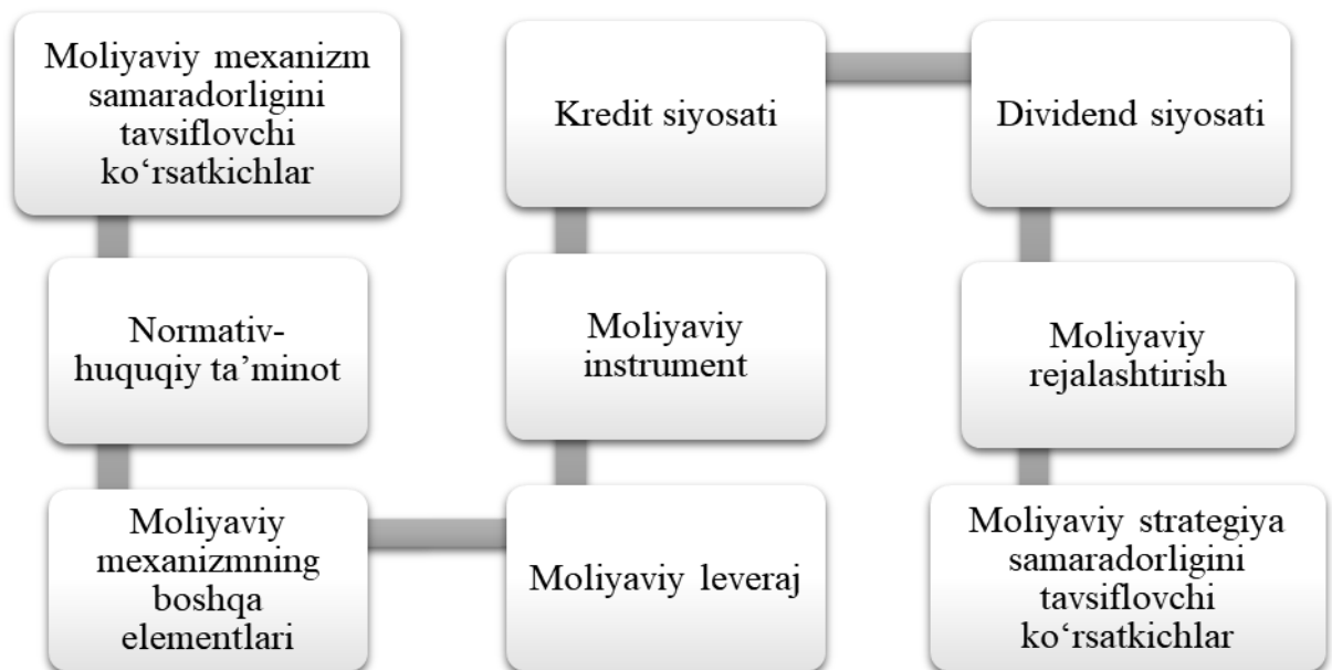
2-rasm. Moliyaviy mexanizm va moliyaviy strategiya elementlarining o'zaro bog'liqligi 2

Aytish mumkinki, moliyaviy strategiya ikki tomonlama funksiyani bajaradi, bir tomondan, moliyaviy mexanizmning asosiy elementi rolini bajaradi, ikkinchi tomondan esa moliyaviy mexanizm elementlarini o'zaro munosabatlarini belgilaydi, bu esa uning zarurati va ahamiyatini ochib beradi. Moliyaviy strategiya kompaniyaning ko'proq tashqi muhit ta'siri bilan bog'liq xususiyatlarini inobatga olgan holda faoliyat yo'nalishlari ishlab chiqilishini hisobga olsak, uning tarkibiy qismlarini ikki guruhga bo'lish mumkin, ya'ni: moliyaviy strategiyaning elementlari va ular o'rtasidagi o'zaro munosabatlar tizimi (2-rasm).